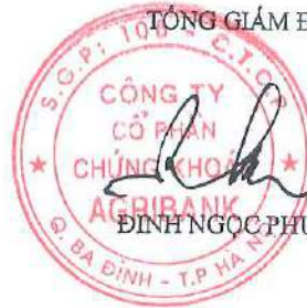
ĐINH NGỌC PHƯƠNG