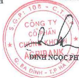
ĐINH NGỌC PHƯƠNG