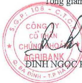
ĐINH NGỌC PHƯƠNG