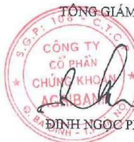
ĐINH NGỌC PHƯƠNG