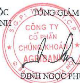
ĐINH NGỌC PHƯƠNG